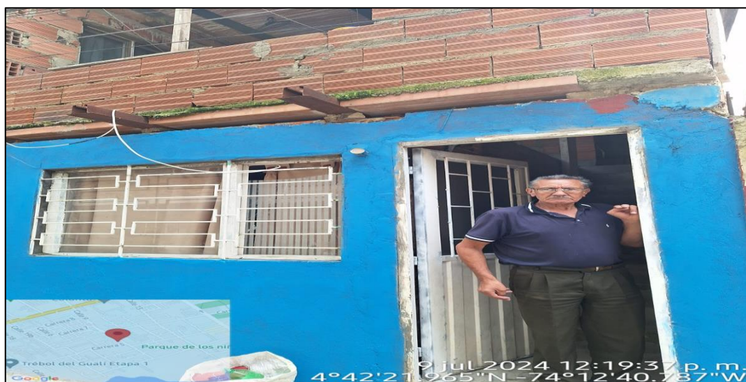
Ilustración 2. Ubicación predio.