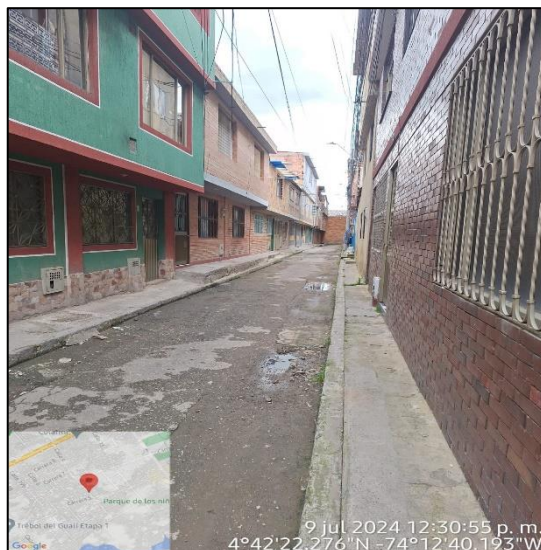
Ilustración 3. No se evidencia disposición inadecuada de residuos sólidos.