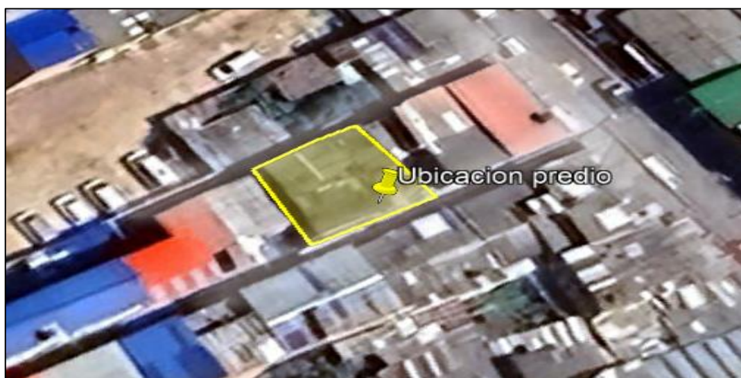
Ilustración 1. Ubicación del predio Fuente: Google Earth.